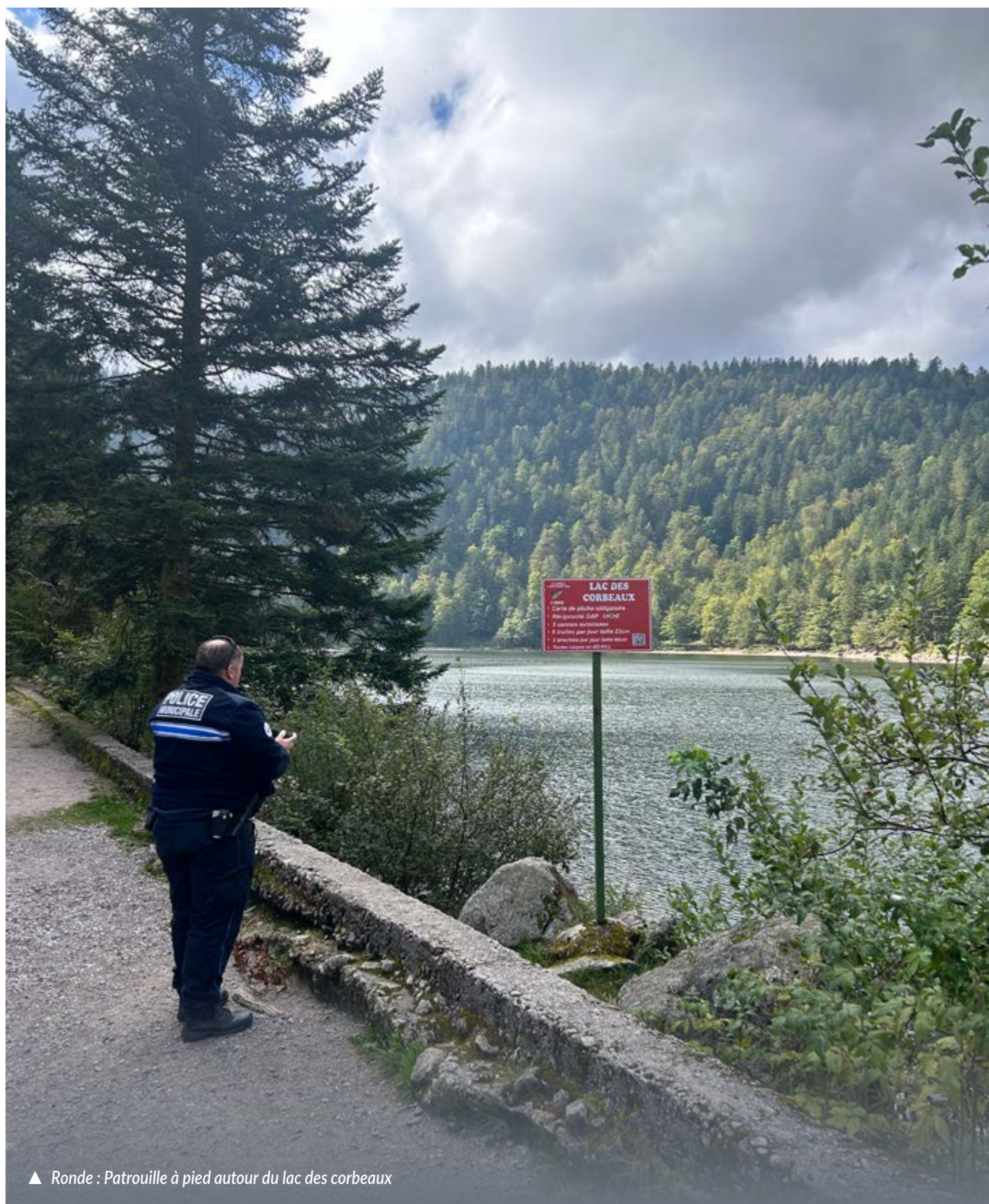
▲ Ronde : Patrouille à pied autour du lac des corbeaux