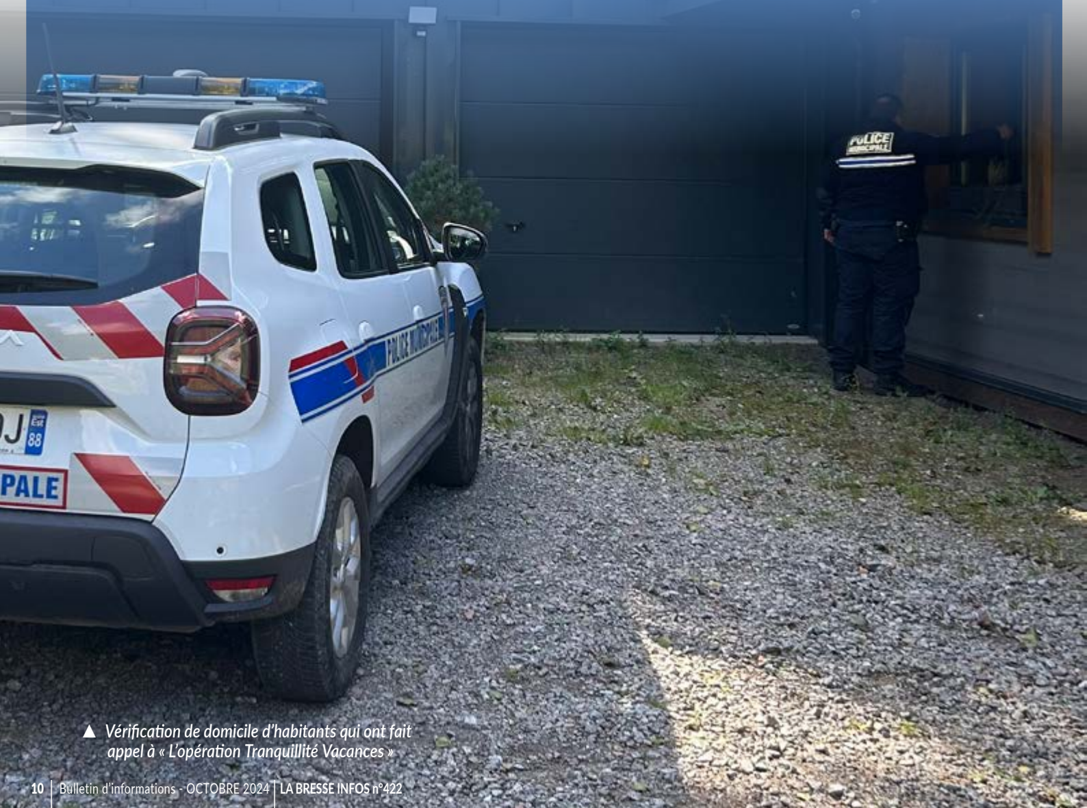
▲ Vérification de domicile d'habitants qui ont fait appel à « L'opération Tranquillité Vacances »