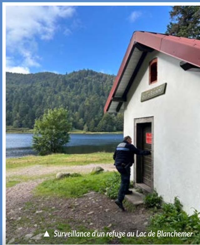
▲ Surveillance d'un refuge au Lac de Blanchemer

Un ASVP renforce le service durant la période hivernale pour contrôler le stationnement au niveau des stations de ski. Une convention de mutualisation de mise en commun avec la police de Cornimont est en place depuis 2021.